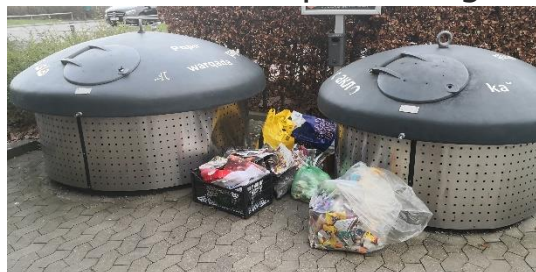
1Molokker er kun til papir og glas

Fra driften blev der på bestyrelsesmødet orienterede om affaldspladsen og de ugentlige besparelser der er ved at affaldet bliver sorteret. Omkostningerne ved at komme af med affaldet er faldet fra ca. 20.000 til 6.000 om ugen. Der er stadig en del udfordringer med beboer der sætter affald ved opgangene og andre steder. Der bruges ca. 37 timer om ugen til opsamling af dette affald. Det skal minimeres således der ikke står affald nogen steder.